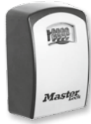
Art.-Nr. 570011 – aus Aluguss, im Groß- format, KRUSE SchlüsselBox 4/1 maxi