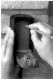
Montage der KRUSE SchlüsselBox 4/1