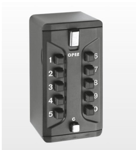
SchlüsselBox maxi geschlossen