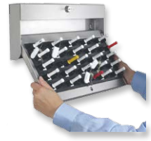
Art.-Nr. 565000 Wandhalterung