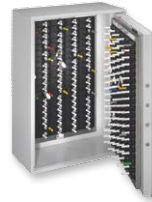
Art.-Nr. 565015 Umschrank plus